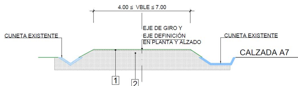
Imagen 3: Sección tipo 3: Caminos