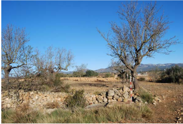
2. Refugio: Coord. UTM 31T 248201 4454222