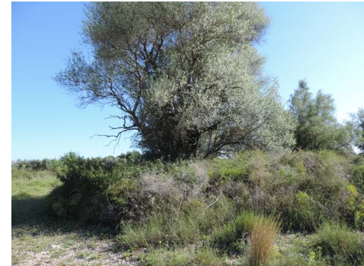
122. Olivo ancestral y posible ro gle Coord. UTM 31T 258264 4478634

Junto al Barranc de les Socarrades la vegetación es muy densa, e impide la correcta visualización del elemento, así como de parte de la banda de estudio. Se propone su documentación así como seguimiento arqueológico al tramo.