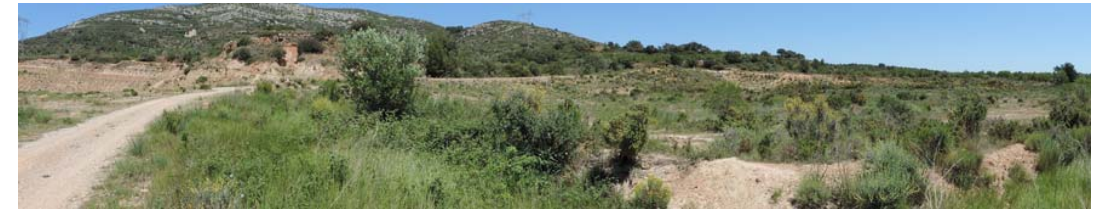
Vista general del tramo final de proyecto

336. Segmento final del proyecto: Coord. UTM 31T 268388 4489552