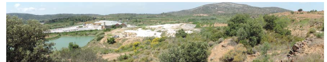
Vista general de la zona

350. Tramo muy antropizados: Coord. UTM 31T 269171 4489111