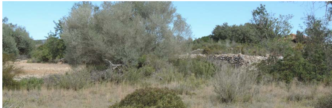
Vista general del ámbito

58. Banda de paso: Coord. UTM 31T 252831 4464702