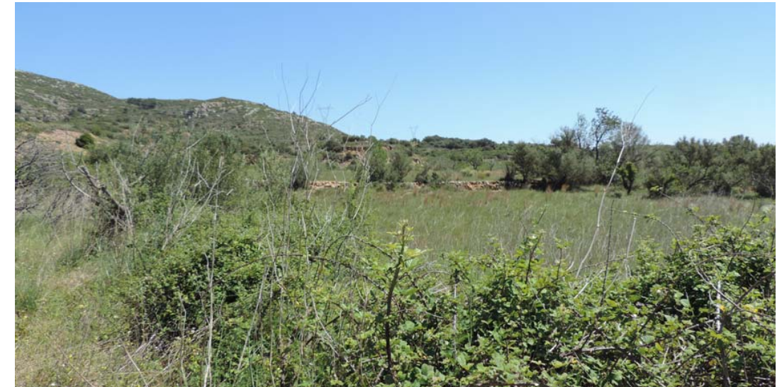
Vista global del tramo

Desde el punto indicado por la coordenada se toma la siguiente fotografía, que muestra el estado del ámbito de proyecto; se recomienda seguimiento intensivo a las labores de desbroce.