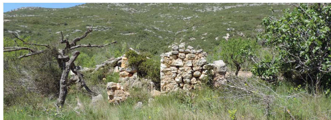
121. Caseta de aperos: Coord. UTM 31T 258362 4475942

Sin afección por parte del proyecto, situada en parcelas que, hacia el este, recaen en el margen de seguridad. Esos terrenos presentan óptimas condiciones para el desarrollo de la prospección, pero no aportan vestigios arqueológicos.