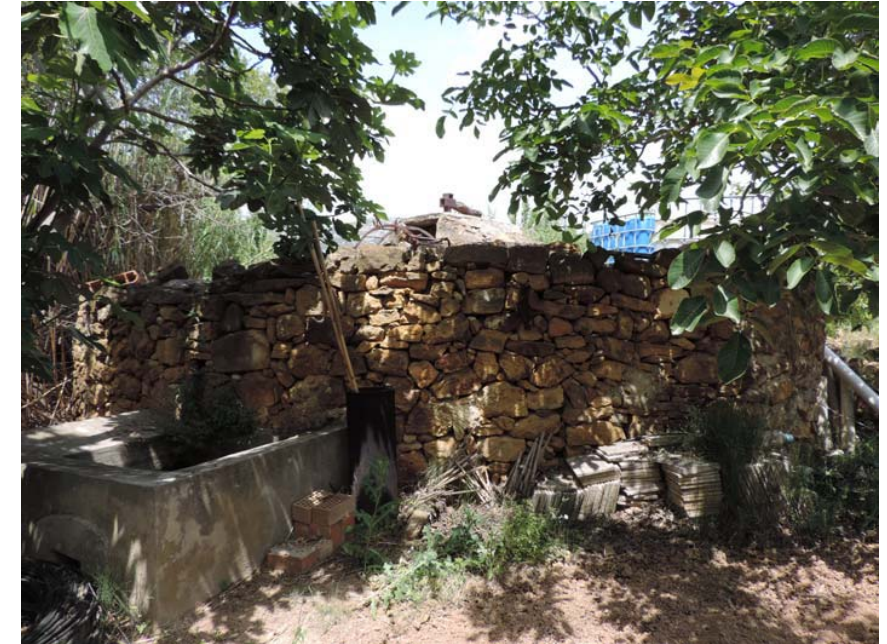
Noria en buen estado de conservación

353. Noria, Pozo y otros: Coord. UTM 31T 269376 4488896