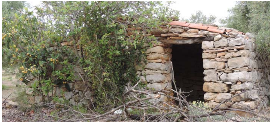
221. Refugio: Coord. UTM 31T 261272 4486187