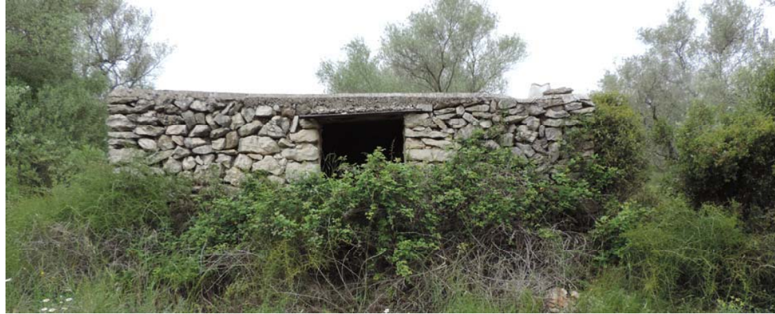
178. Maset: Coord. UTM 31T 258337 4482614

Maset o refugio adaptado a uso como vivienda, dotado de hogar, situado en el margen de seguridad, sin afección directa y de escaso interés por se. Presenta obras recientes.