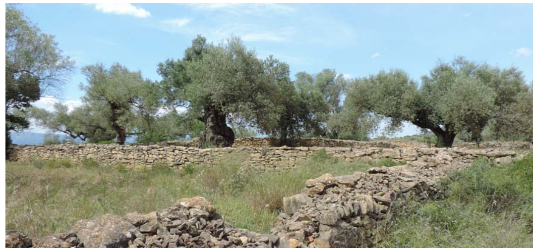
Márgenes y olivos milenarios

Desde este mismo punto se toma la siguiente fotografía, que muestra el paisaje cultural que es este entorno y que recibe la afección directa por parte del proyecto.