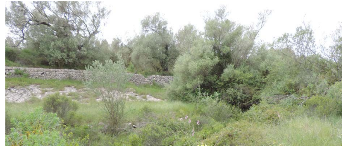
180. Escollera: Coord. UTM 31T 258346 4482725

Sobre La Rambleta, a ambos lados de la misma y con doble paramento en algún tramo, el proyecto prevé intersección con esta escollera, construida mediante la técnica tradicional de mampostería en seco.