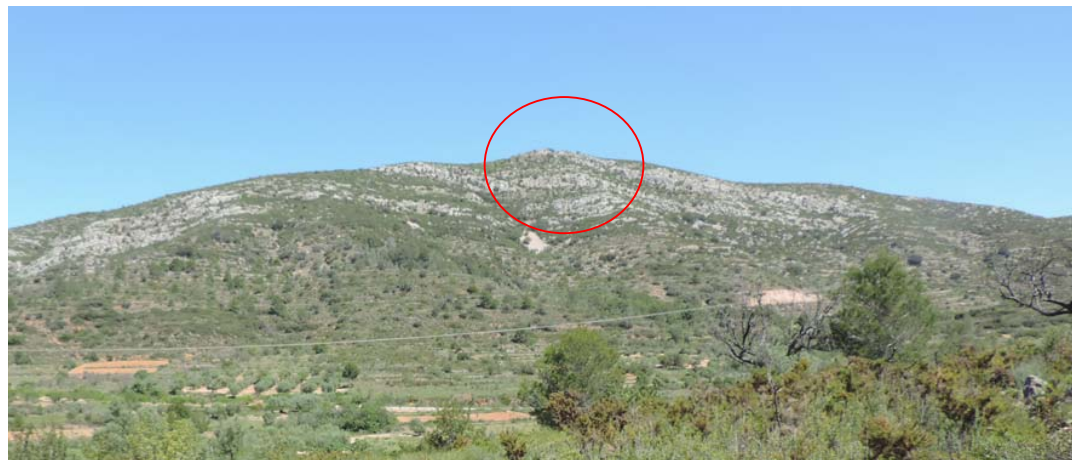
Ermita de Sant Pere y yacimiento Ladera de Sant Pere.

Desde este punto se toman las siguientes fotografías: