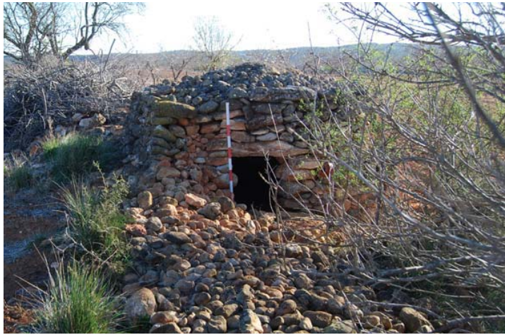
Refugio de pastor (barraca en la toponimia local); sin riesgo de afección por parte del proyecto.

Tampoco en este entorno se observan restos asociables a un área de interés arqueológico.