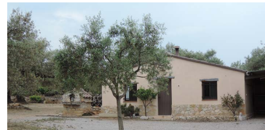
Maset de uso vacacional y como caseta de aperos

375. Maset; Coord. UTM 31T 258426 4482308