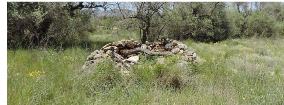
144. Cucó: Coord. UTM 31T 258004 4480769

Refugio o cucó hundido, frente a la banda de proyecto, sin afección directa por parte de éste. Deberá ser catalogado.