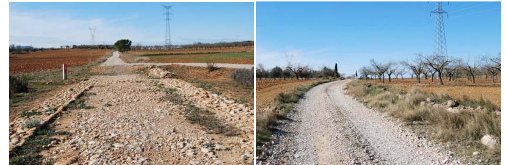
5. VÍA AUGUSTA: Coord. UTM 31T 248258 4454896

En la toponimia local este camino es conocido como Senda dels Romans; en realidad se trata de la Vía Augusta, una de las obras de ingeniería más singular que la antigüedad romana ha legado.