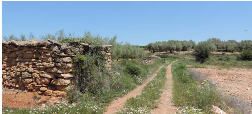
137. Caseta refugio: Coord. UTM 31T 258016 4480085