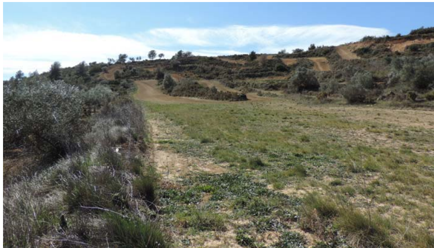
Vista general de la pista de motocross, norte/sur

En estos terrenos tampoco se han hallado restos de interés arqueológico; algunas parcelas sí presentan muros de mampostería en seco en buen estado de conservación.