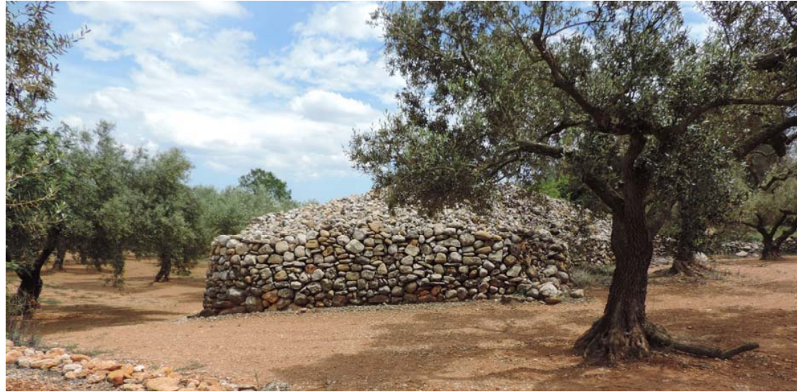
Muro de mampostería en seco de excelente fábrica y gran tamaño.

285. Marge: Coord. UTM 31T 265386 4488577