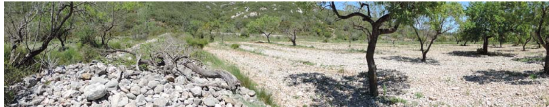
120. Posible estructura hidráulica: Coord. UTM 31T 258303 4476065