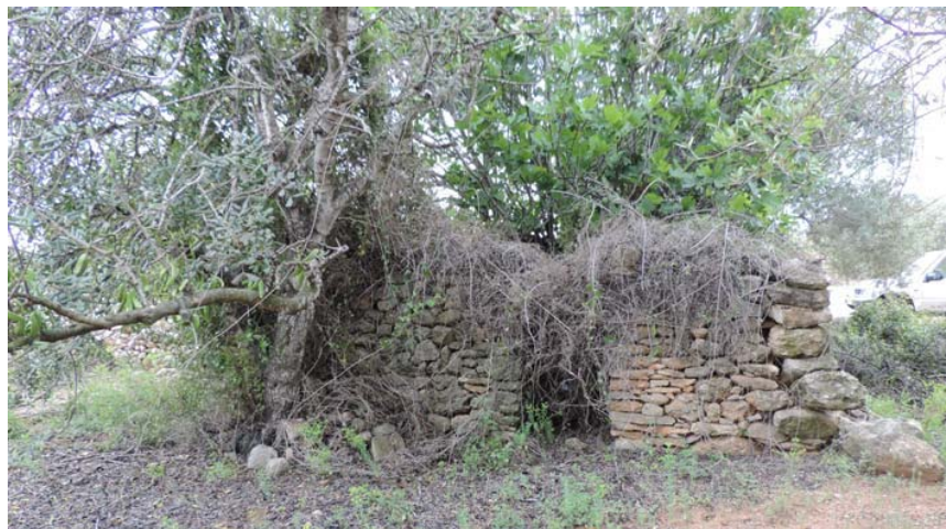
Refugio de planta cuadrangular con la techumbre hundida. Recibe afección directa por parte del proyecto. Deberá ser catalogado adecuadamente.