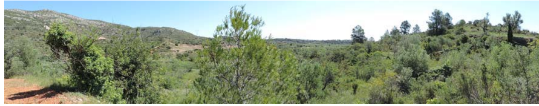
Vista general de la banda de paso del proyecto

326. Banda de paso del proyecto: Coord. UTM 31T 268027 4489323