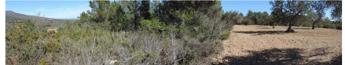
42. Entorno de PK 9+600: Coord. UTM 31T 251415 4462292

En este segmento de proyecto, hacia el Norte se observa una zona con densa vegetación y, hacia el sur, terrazas en producción sobre las que no se observan restos arqueológicos.