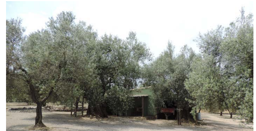
181. Parany: Coord. UTM 31T 258377 4483054

Caseta de aperos de reciente construcción y olivos en proceso de transformación a parany; sin interés particular.