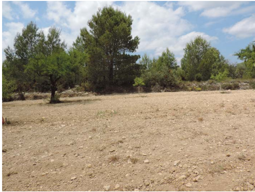
Vista general del área del proyecto por las inmediaciones del entorno del yacimiento.

387. VÍA AUGUSTA Y OTROS: Coord. UTM 31T 248772 4456325