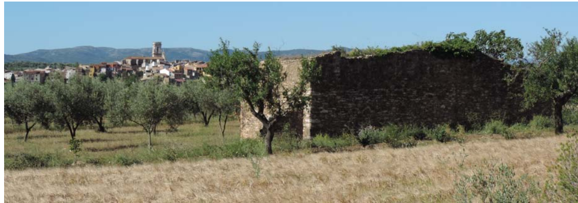
La Jana al fondo de la imagen

319. Maset: Coord. UTM 31T 267525 4489089