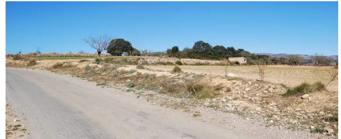
Vista del camino y de la continuación de la banda de paso

8. Camí Vell de Torreblanca: Coord. UTM 31T 248270 4455207