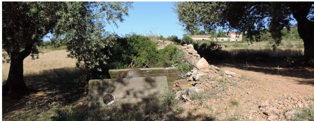
Refugio en primer plano y Venta de la Mona al fondo de la imagen.

316. Refugio: Coord. UTM 31T 267519 4489270