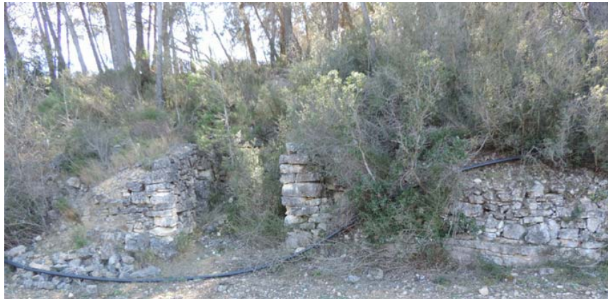
41. El Pouet: Coord. UTM 31T 251364 4461918