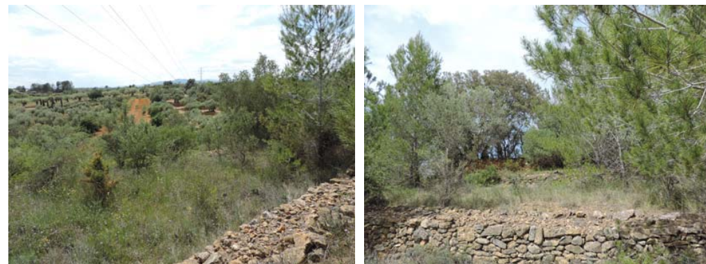
Tramo anterior Tramo posterior Vista general de la banda de paso del proyecto

296. Banda de paso del proyecto: Coord. UTM 31T 265749 4488797