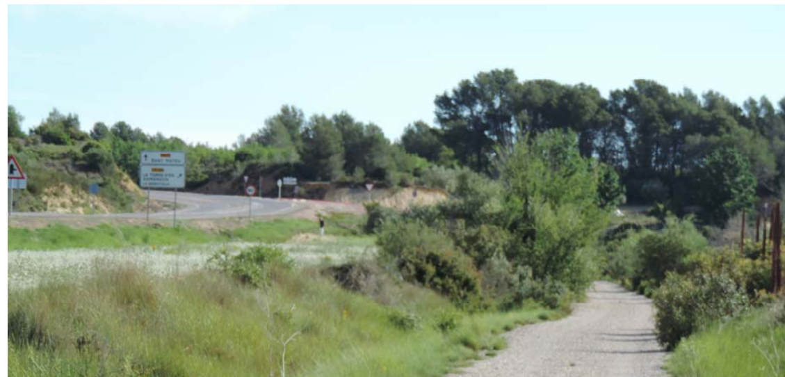
VÍA AUGUSTA A LA DERECHA DE LA IMAGEN

279. LA GARRIGA: Coord. UTM 31T 251422 4460445