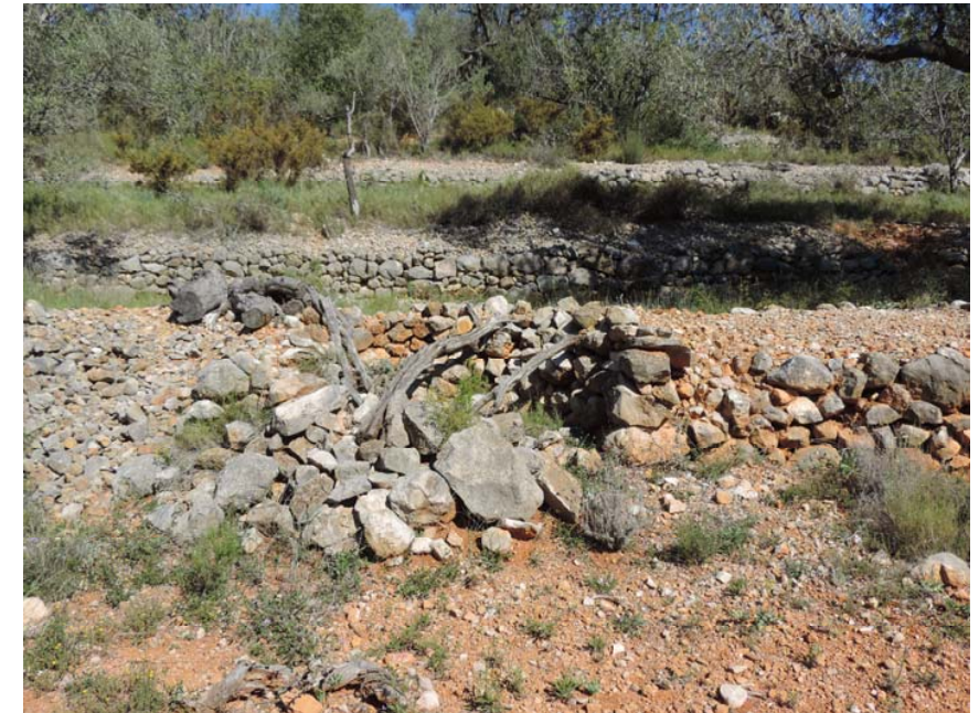
Terrazas y vegetación en la zona

102. Ladera de la Solana: Coord. UTM 31T 257541 4475334