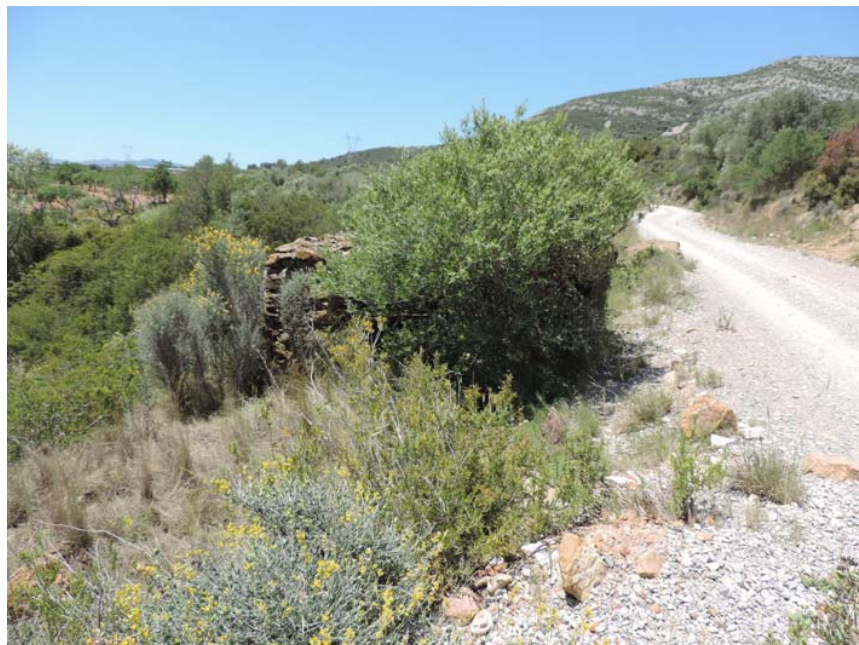
Situado junto al Camí de les Esquirols, fuera de la banda de afección del proyecto.

338. Refugio: Coord. UTM 31T 268687 4489667