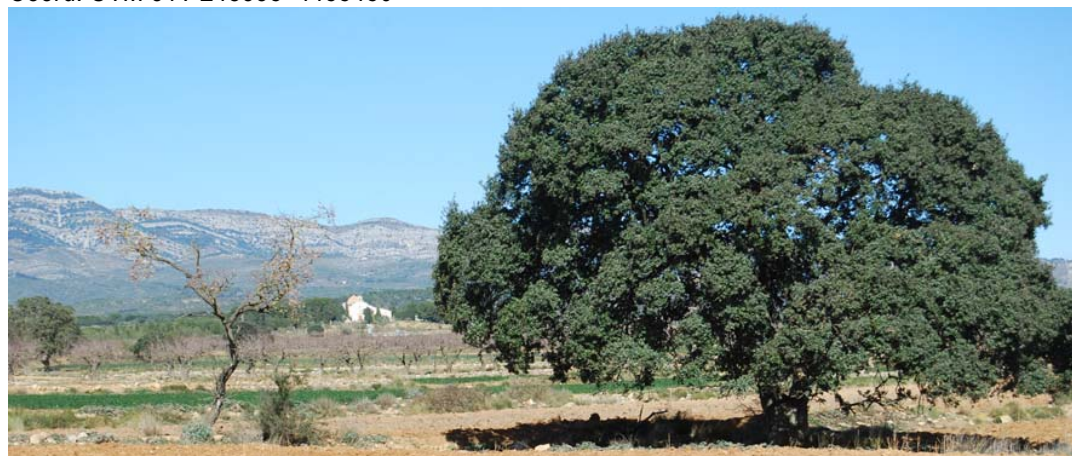
Al fondo Ermita de Nuestra Señora del Adyutorio, retirada del ámbito del proyecto.

Este segmento del proyecto, que discurre por terrenos en óptimas condiciones para el desarrollo de la prospección, no aporta restos que permitan intuir la presencia de algún yacimiento arqueológico.