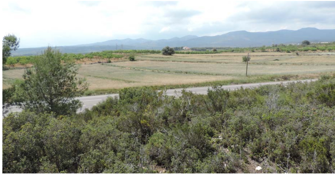
Vista general de la zona, cubierta de vegetación.

389. Aljibe: Coord. UTM 31T 248740 4456195