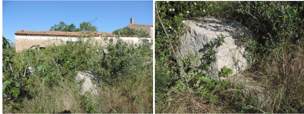
Sillares junto a la Venta de la Mona

Los campos de alrededor, tanto en el margen de seguridad del proyecto como en la banda de paso del miso, no aportan restos arqueológicos asociables a los sillares pero, a pesar de ello, se propondrá la aplicación de un seguimiento a los desmontes del tramo, así como la catalogación de la venta.