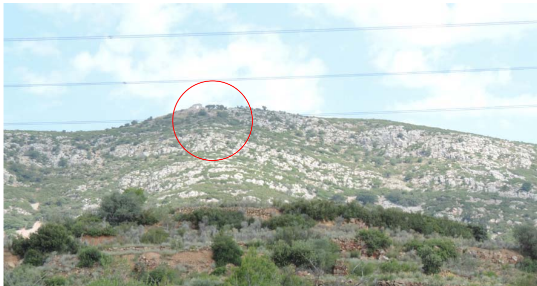
Ermita de Sant Pere y yacimiento laderas de San Pere

Desde este punto se toma la siguiente imagen: