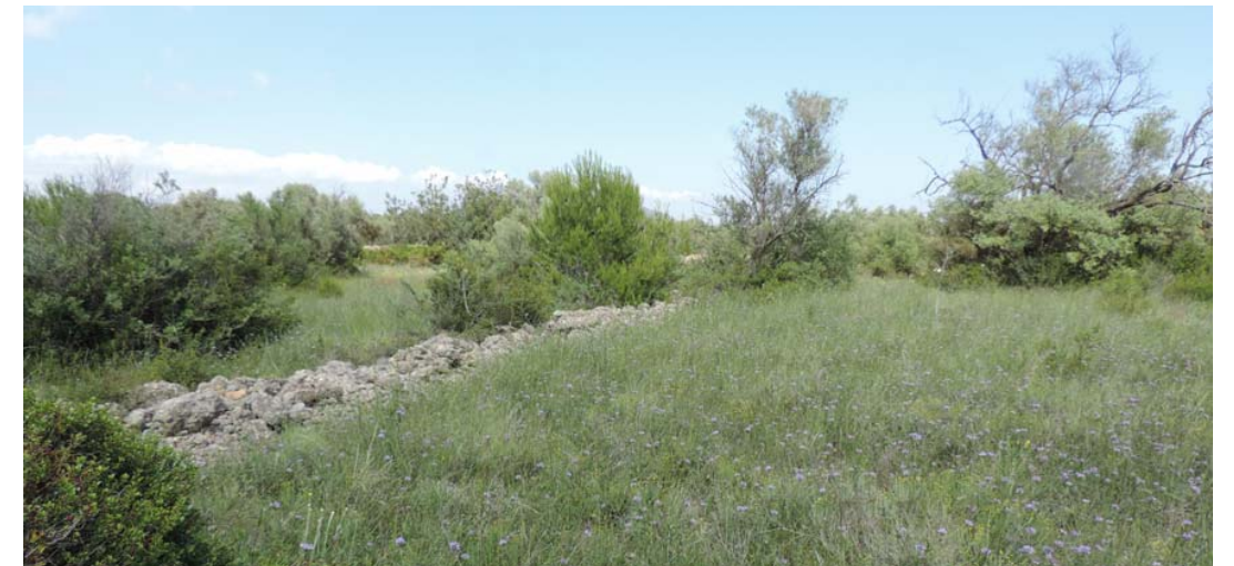
Vista general de la banda de paso del proyecto

254. Banda de paso del proyecto: Coord. UTM 31T 263000 4487627