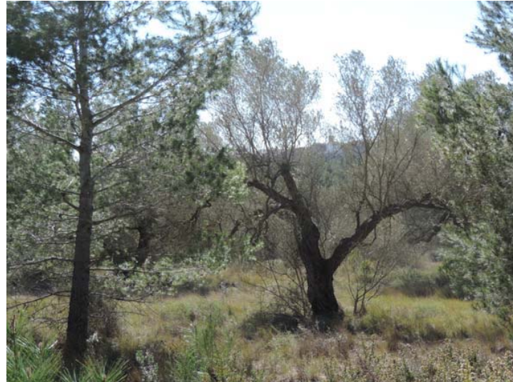
Vista general del tramo entre PK 9+300 y PK9+500

37. Continuación de la banda de trabajo: Coord. UTM 31T 251375 4462185