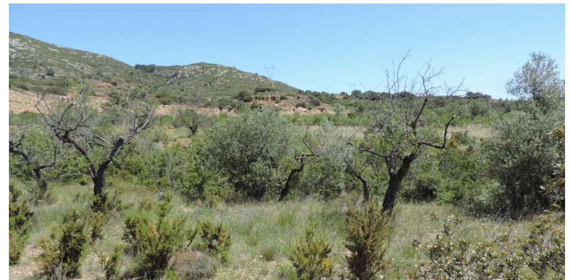
330. Barranc de les Esquirols: Coord. UTM 31T 268222 4489427

Punto en el que el proyecto alcanza el Barranc de les Esquirols; la intersección se produce en una zona de densa vegetación, por lo que se propone la aplicación de seguimiento intensivo a los desbroces en este segmento del proyecto.