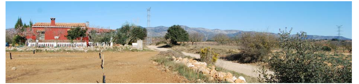
4. Casa de campo: Coord. UTM 31T 248268 4454667

Construcción sin interés per se, afectada por el proyecto. Se sitúa junto a la Vereda de la Fusta, con la que el trazado prevé intersección. Los terrenos colindantes no presentan vestigios arqueológicos.