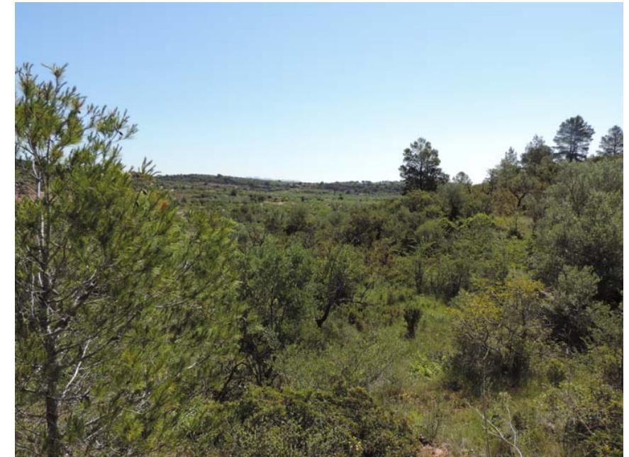
Se propone el seguimiento de los desbroces a este tramo.

En este tramo, el proyecto discurre por el piedemonte de un cerro que presenta óptimas condiciones para su ocupación desde la antigüedad, por lo que ha sido incluido en la prospección y cabe destacar que, en sus laderas, no se han hallado restos de interés. Su cima y cotas más elevadas se encuentran cubiertas de vegetación.