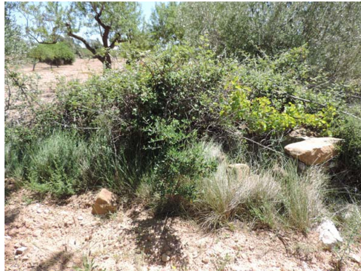
Estructura hidráulica indeterminada

335. Refugio: Coord. UTM 31T 268352 4489507