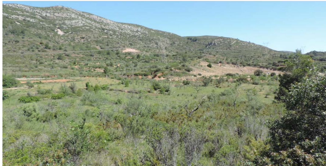
328. Pozo: Coord. UTM 31T 267951 4489294