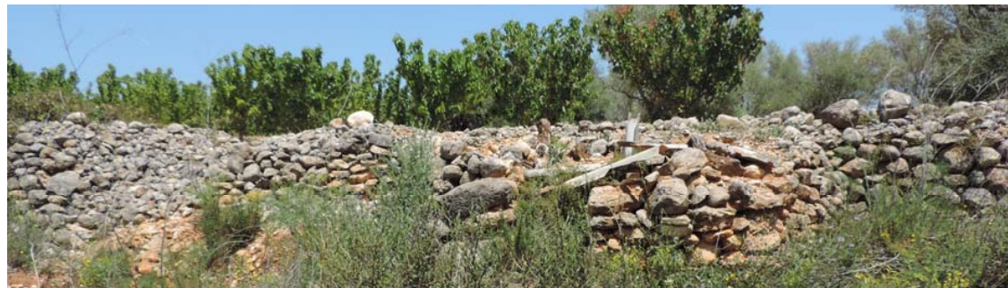
142. Cucó o pequeño refugio: Coord. UTM 31T 258060 4480287

Pequeño refugio de planta circular, hundido. Está construido sobre un muro de mampostería en seco. Se sitúa sobre un antiguo préstamo y terrenos con buena visibilidad en los que, ni en las secciones de desmonte ni en superficie, se observan restos de interés patrimonial.