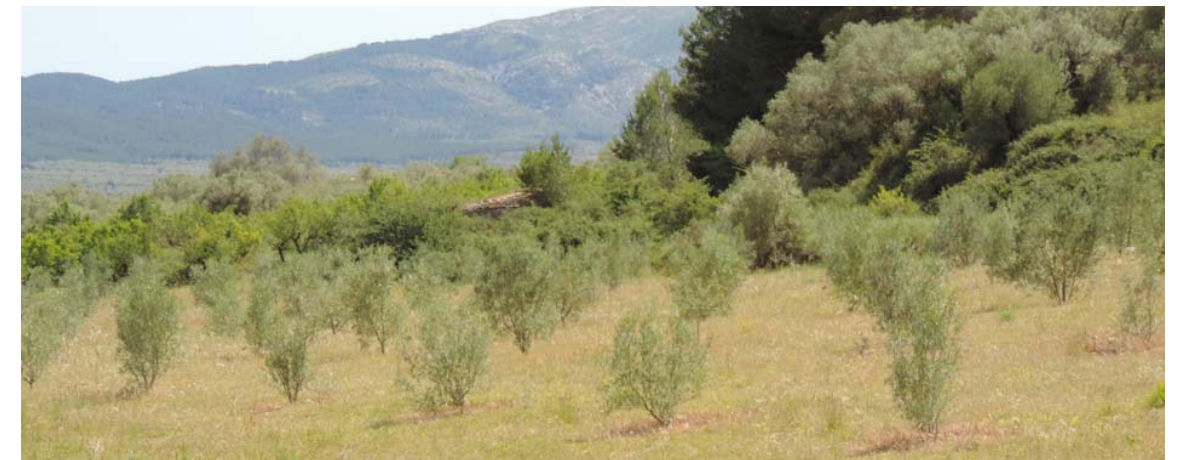
Zona con cierto grado de vegetación.

Desde el punto indicado por la coordenada se toma la imagen panorámica que muestra la zona de construcción de un marco.