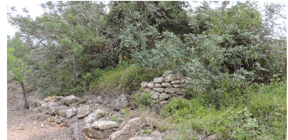
Refugio trabado a un muro de mampostería, en muy mal estado de conservación. Se verá afectado por el proyecto pero, de manera previa, deberá ser catalogado adecuadamente.