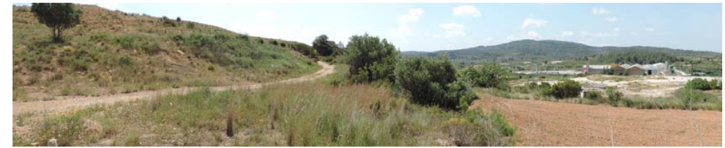
Vista general del ámbito

349. Banda de paso del proyecto: Coord. UTM 31T 269082 4489230