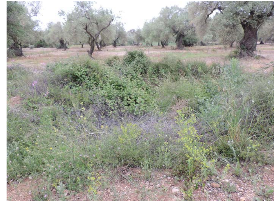
En el ámbito de proyecto, cubierto bajo densa vegetación, se localizan los restos de una oquedad de planta circular y de un diámetro de alrededor de 3 m. Se observa parte de la pared trabajada con mampostería en seco.