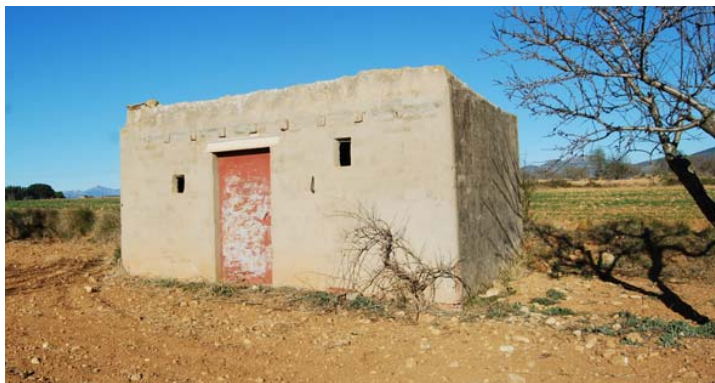
3. Caseta de aperos: Coord. UTM 31T 248270 4454381

Caseta de aperos sin interés, situada en terrenos en los que no se observan restos arqueológicos,