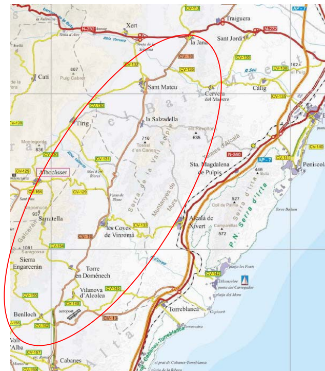
Figura1: situación del ámbito de proyecto

La siguiente figura muestra la situación del proyecto al que se refiere este estudio: