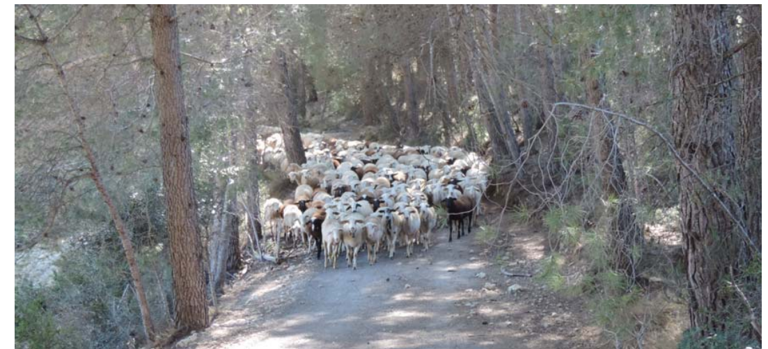
44. Camí del Pouet: Coord. UTM 31T 251482 4462093

Senda ancestral que no debería ser interrumpida por el proyecto, afección posible en el punto del cruce del Barranc Tornés.