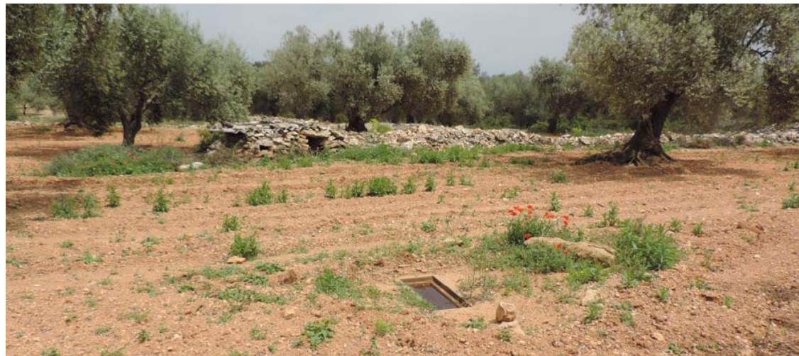
179. Ojeo de caza: Coord. UTM 31T 258343 4482626

Ojeo de caza, sin interés patrimonial y ubicado en el margen de seguridad del proyecto. Debería ser catalogado como los demás elementos aquí reseñados.