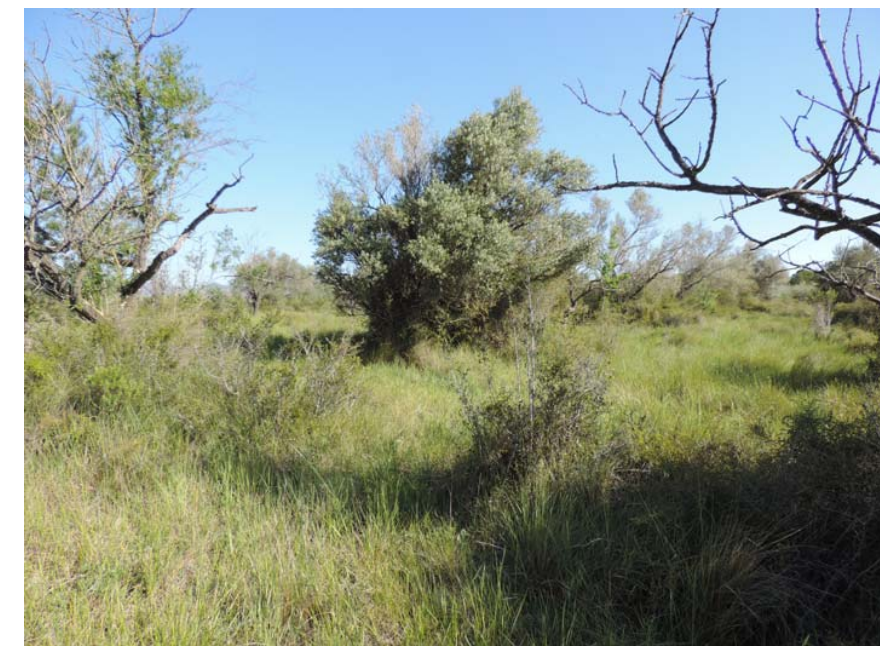
123. Tramo con vegetación: Coord. UTM 31T 258231 4478638

Junto al Barranc de les Socarrades la vegetación es muy densa, e impide la correcta visualización del elemento, así como de parte de la banda de estudio. Se propone su documentación así como seguimiento arqueológico al tramo.