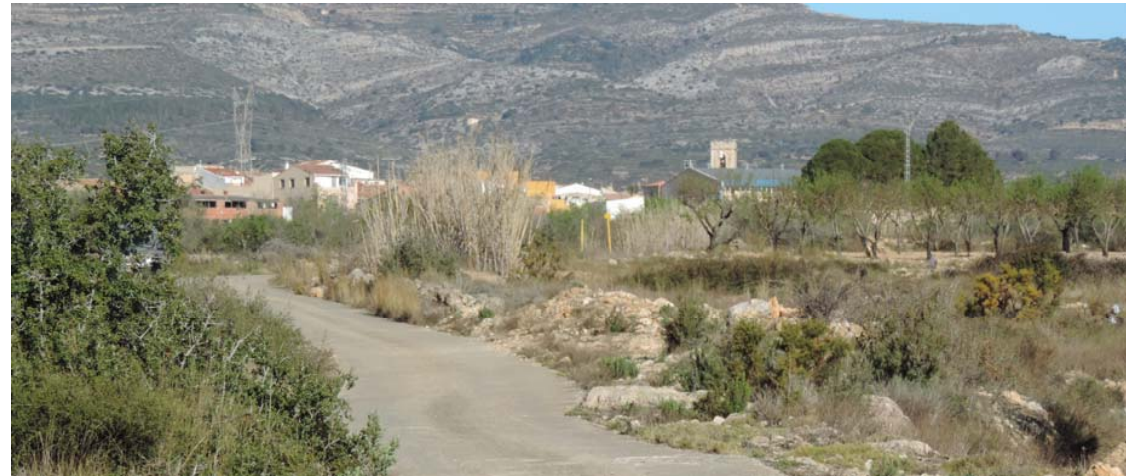
Camí de la Garriga

Este segmento de proyecto discurre por terrenos aterrazados, con muros de mampostería en seco de diferente entidad, que asimismo presentan diferente estado para el correcto desarrollo de la prospección y en los que no se observan vestigios asociables a un área de interés arqueológico.