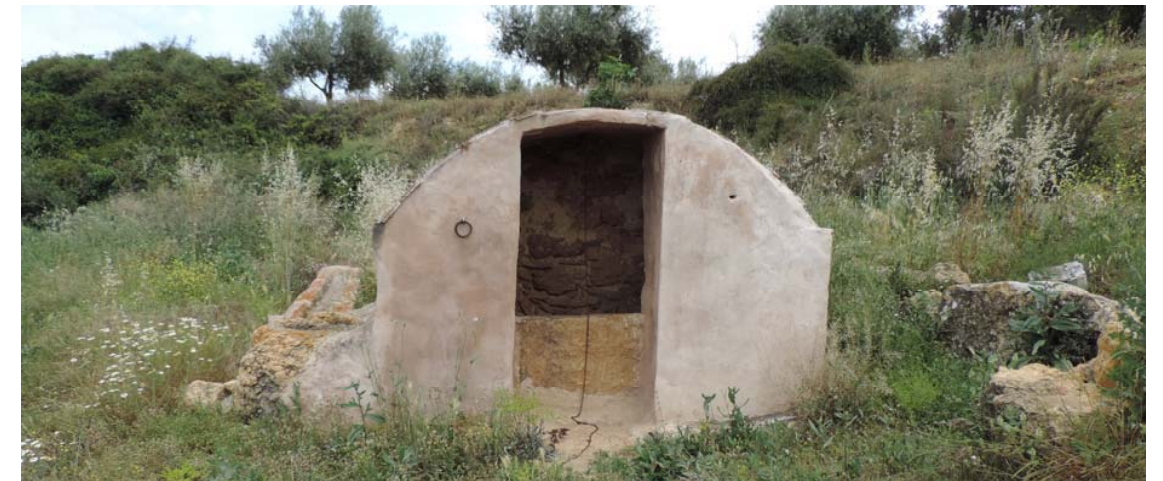
Pou del Mas

Ecomuseo de olivos milenarios junto a la banda de paso del proyecto y, asociado a éste pero fuera del riesgo de afección directa, el Pou del Mas y la senda Vía Augusta.