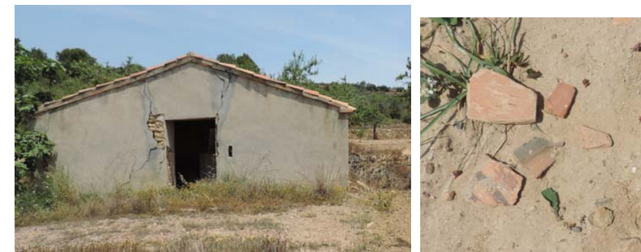
Maset con obras de mantenimiento recientes y cerámicas de interés.

354. Maset y cerámicas de interés: Coord. UTM 269376 4488896