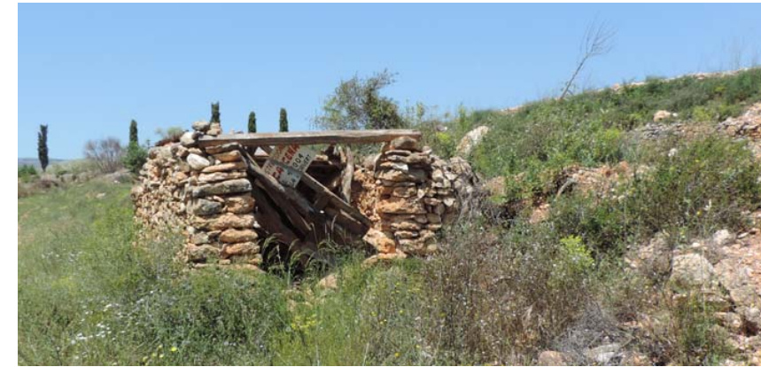
143. Refugio: Coord. UTM 31T 257984 4480347

Refugio de planta cuadrangular en muy malas condiciones de conservación situado en un área de antiguo préstamo; deberá ser catalogado dada su inmediatez a la banda de paso del proyecto ya que es tangente a éste. Deberá balizarse para evitar daños accidentales.