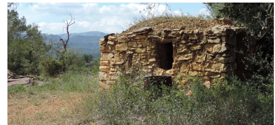
Refugio junto a un aljibe; recibe la afección directa por parte del proyecto.

298. Refugio y aljibe: Coord. UTM 31T 265784 4488821