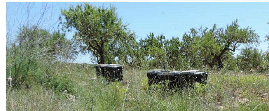
La zona elevada está siendo usada para la actividad de apicultura.

Este tramo final del tronco del vial aquí estudiado cruza parcialmente por una zona de antiguo préstamo, en abandono y colmatado en parte por escombros y otros vertidos.