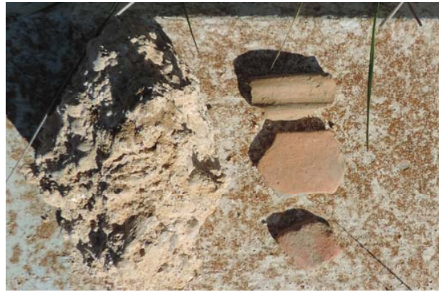
Materiales hallados en la zona

sector del municipio, paso de la Vía Augusta por la zona, a la presencia del yacimiento Els Planells y La Garriga, se aplicarán medidas especiales de salvaguarda.