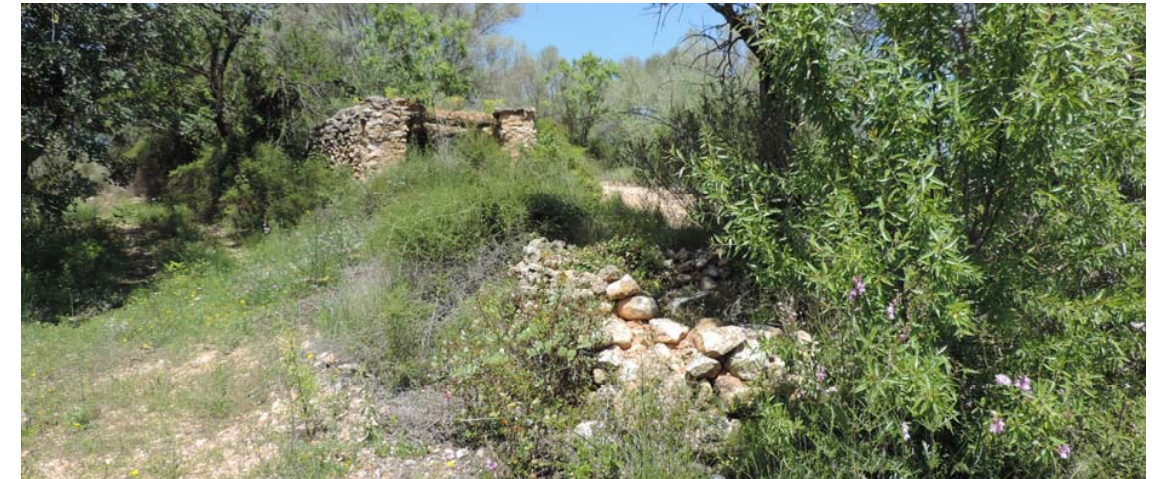
139. Pozo: Coord. UTM 31T 258123 4480551

No reciben afección directa, pero deberían ser catalogados y balizados, para evitar daños accidentales derivados del paso de maquinaria y vehículos pesados por la zona.