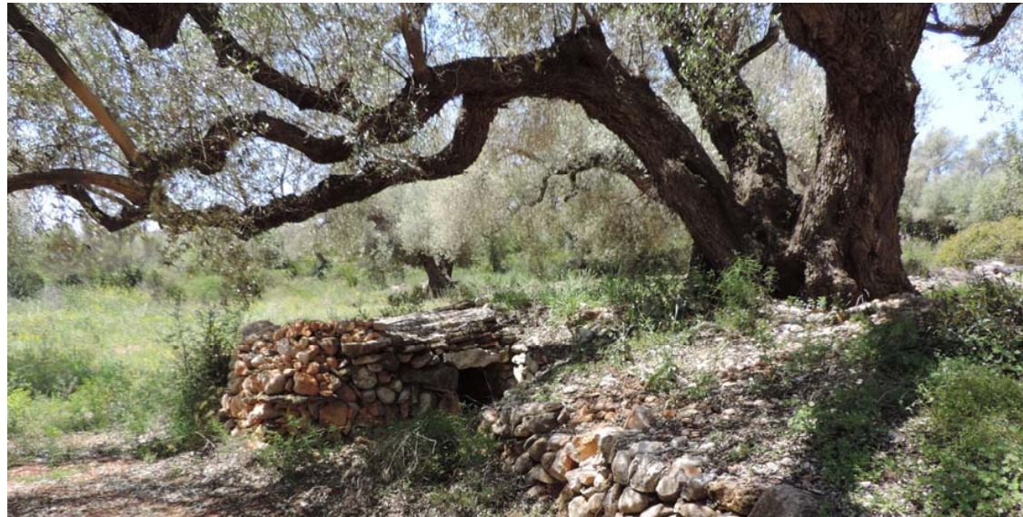
141. Muro de mampostería en seco: Coord. UTM 31T 258006 4480509