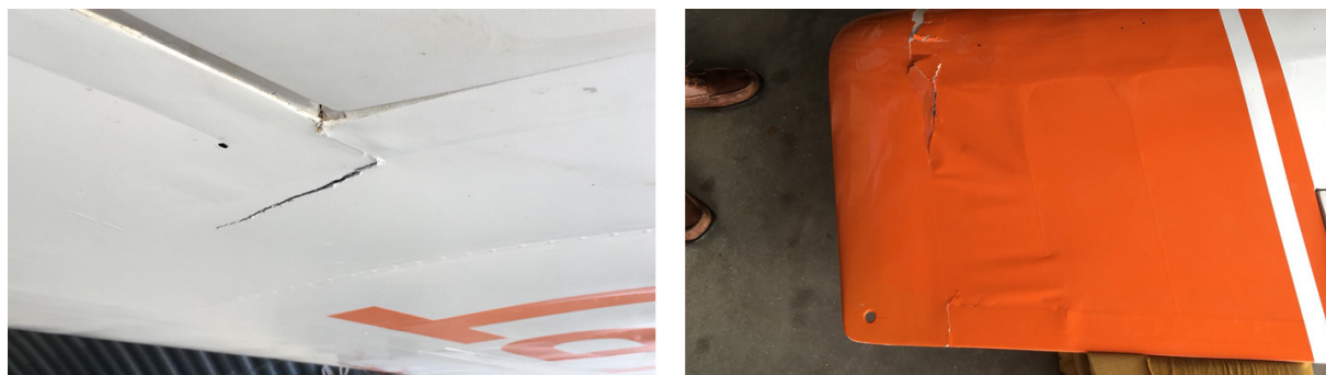
Figura 3. Daños en el plano izquierdo