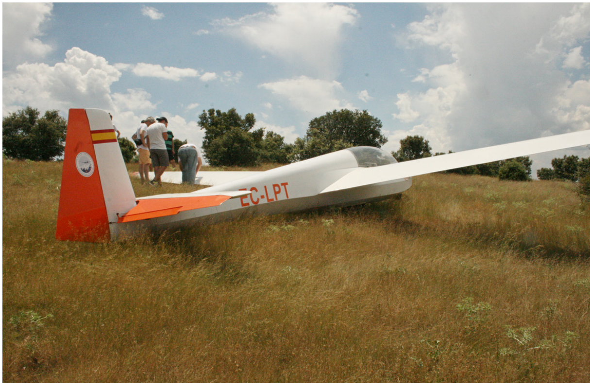
Figura 2. Fotografía de la posición final de la aeronave

Como consecuencia del impacto, solamente resultó dañado el plano izquierdo, que presentaba una grieta en el intradós, junto a la zona donde va rotulada la matrícula y una deformación en la punta que tenía que se manifestaba tanto en el intradós como en el extradós, siendo más visible en esta zona.