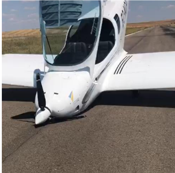
Figura 2: Vista general de la aeronave