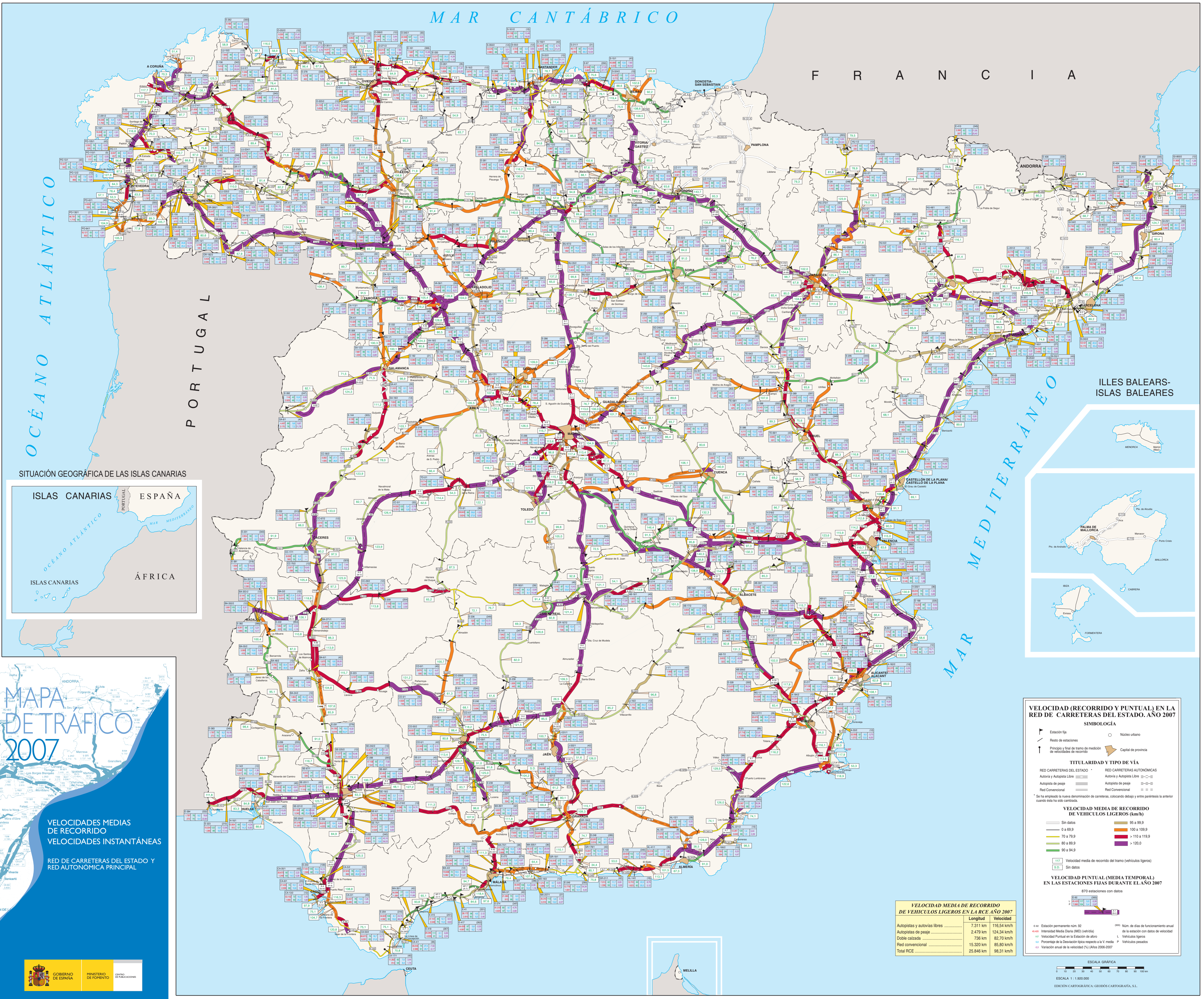
SITUACIÓN GEOGRÁFICA DE LAS ISLAS CANARIAS