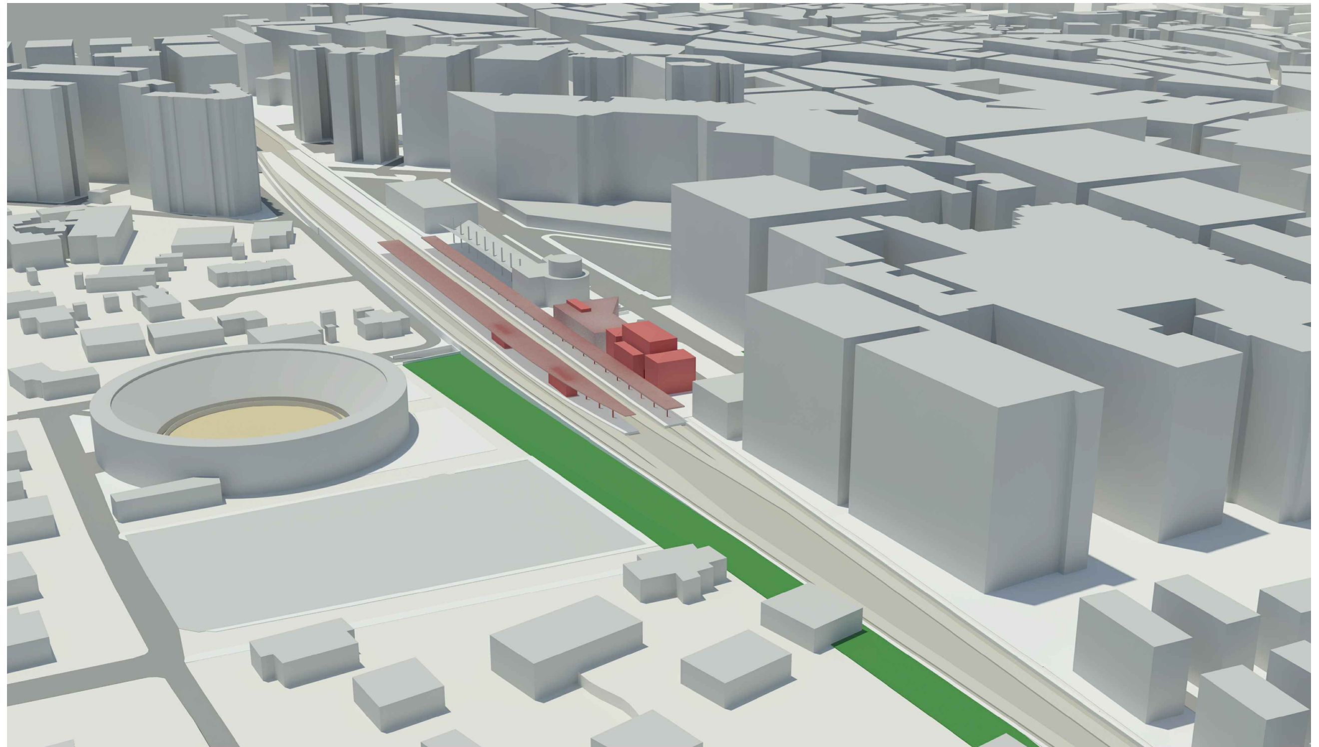
ESTACIÓN DE SUTULLENA ALTERNATIVA 1: SUPERFICIE DOS VÍAS VOLUMETRÍA GENERAL (IMAGEN NO VINCULANTE).