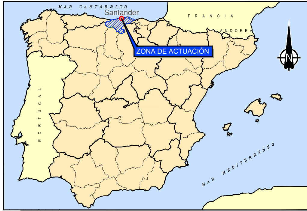
SITUACIÓN GEOGRÁFICA SIN ESCALA