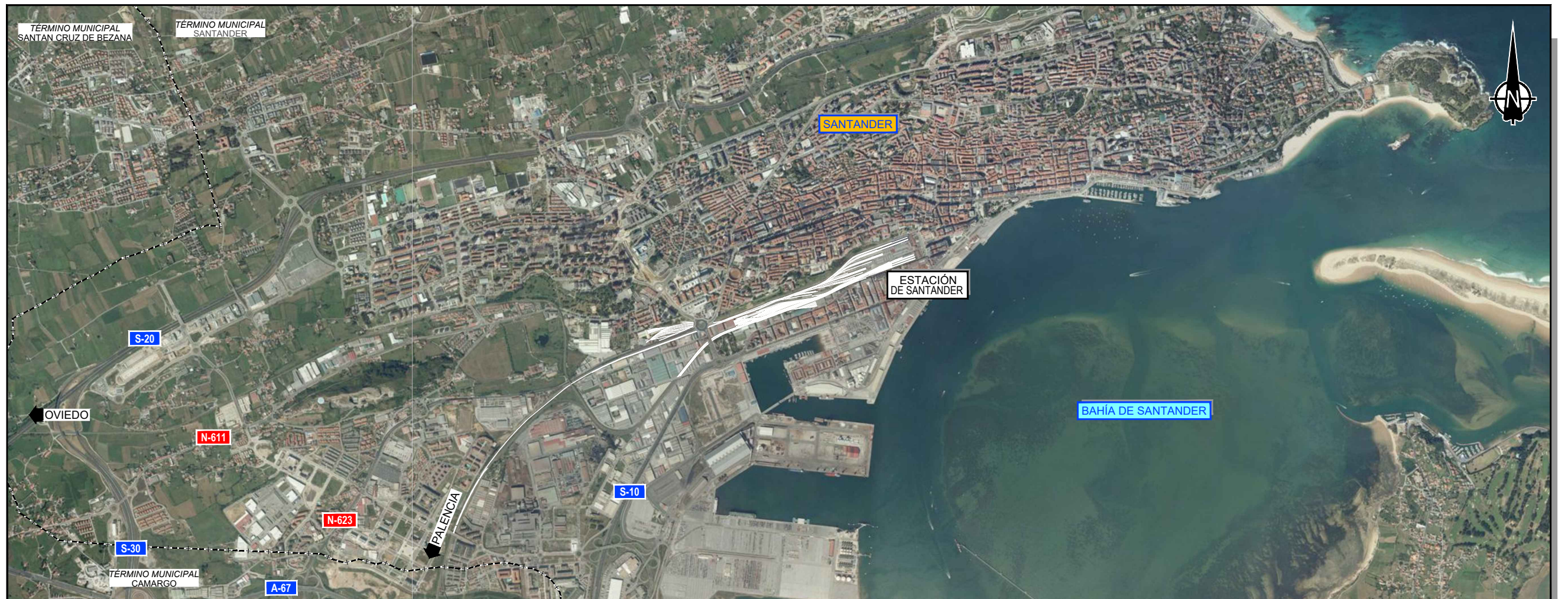
PLANTA DE EMPLAZAMIENTO 1:30.000

Z:\PROYECTOS\2017\17-47-SANTANDER (REC) \TABLADOR\ANEXO ESTUDIO INFORMATIVO\1. SITUACIÓN\1. SITUACIÓN.dwg