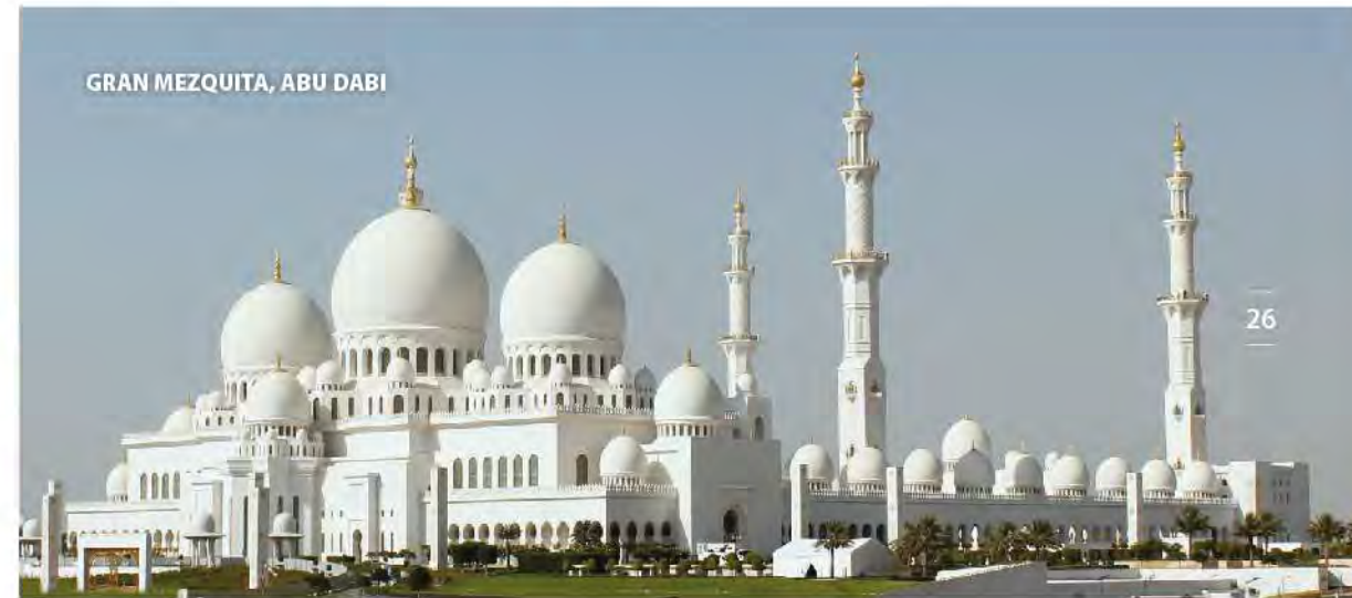
GRAN MEZQUITA, ABU DABI