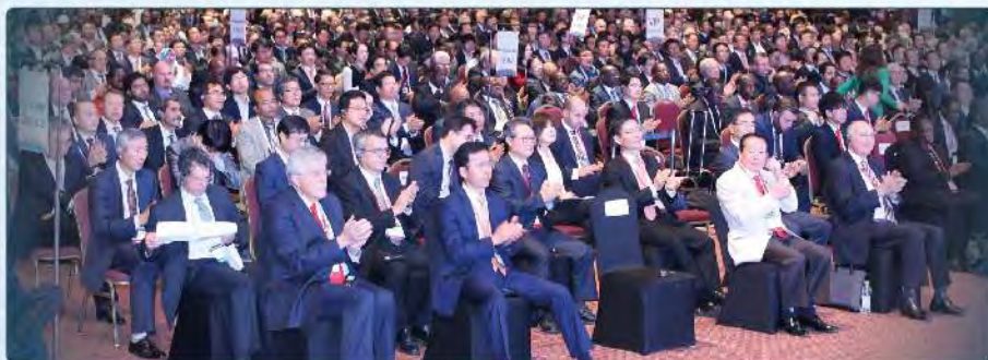
APERTURA DEL CONGRESO MUNDIAL DE LA CARRETERA DE SEÚL DE 2015