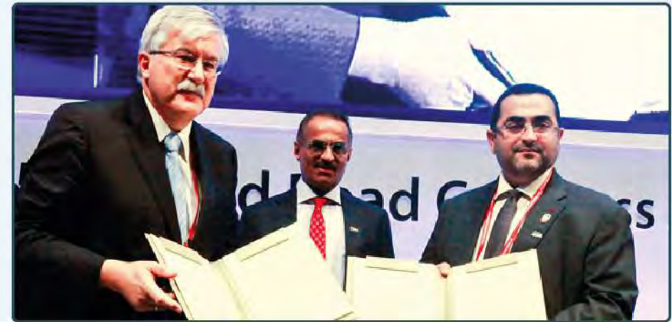
El Departamento de Transporte de Abu Dabi (DoT) fue seleccionado para albergar la 26ª edición de este prestigioso Congreso.

El Departamento de Transporte de Abu Dabi (DoT) fue seleccionado para albergar la 26ª edición de este prestigioso Congreso y acuñó el lema "Conectando Culturas, Fortaleciendo Economías" para establecer debates multilaterales como una forma innovadora de determinar nuevas ideas para un mejor entendimiento de los trabajos en el sector de las carreteras, las infraestructuras y el transporte por carretera.