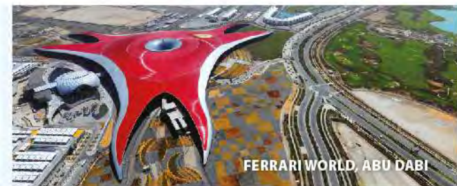
FERRARI WORLD, ABU DABI

Sienta la potencia arquitectónica de la gran mezquita Sheikh Zayed; vaya hasta Corniche, un impresionante paseo marítimo de 8 km con diferentes actividades acuáticas; corre hasta la Isla Yas - sede del Gran Premio de Fórmula 1 de Abu Dabi, a la montaña rusa más rápida del mundo en Ferrari World Abu Dabi, al parque acuático Yas Waterworld y al parque temático Warner Bros Park; descubra el famoso Louvre Abu Dabi; disfrute de la paz y la tranquilidad del manglar de Abu Dabi, aprenda más cosas sobre la antigua tradición de la cetrería o de la historia del emirato, repleto de fuertes y lugares históricos – muchos de los cuales aparecen en la lista oficial de la UNESCO de lugares Patrimonio de la Humanidad.