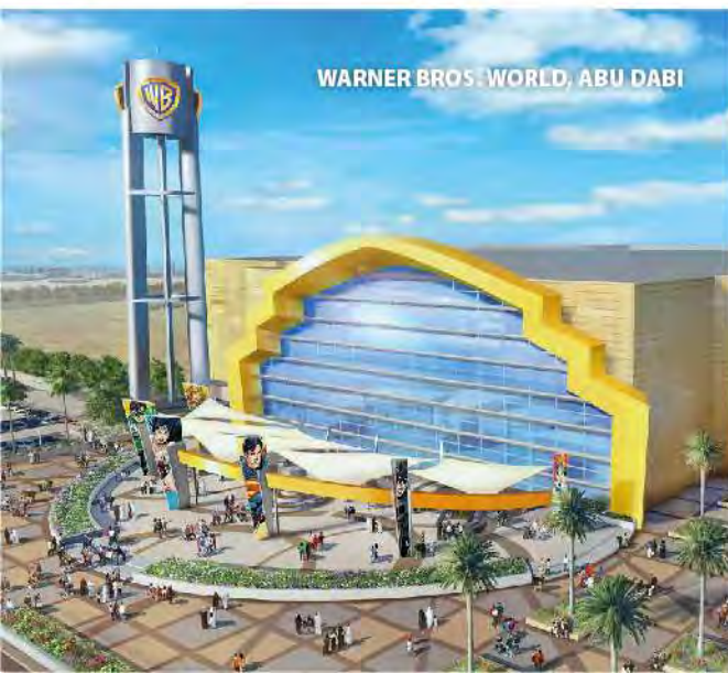
WARNER BROS. WORLD, ABU DABI