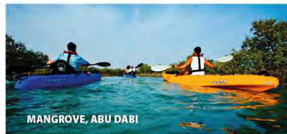
MANGROVE, ABU DABI