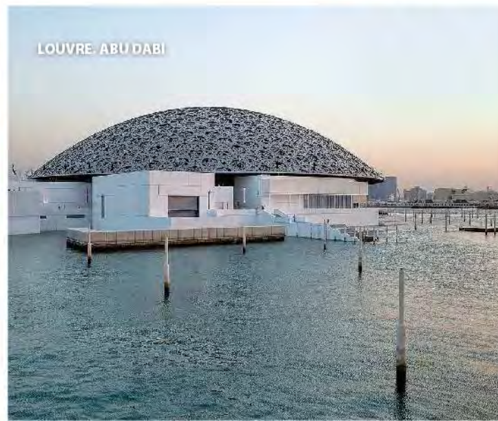
LOUVRE, ABU DABI