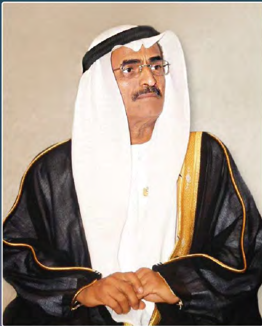
EXCELENTÍSIMO DR. ABDULLAH BELHAIF AL NUAIMI MINISTRO DE INFRAESTRUCTURA Y DESARROLLO PRESIDENTE DEL CONSEJO DE DIRECTORES DE LA AUTORIDAD FEDERAL DE TRANSPORTE - TERRESTRE Y MARÍTIMO

“ ME COMPLACE INVITARLE Y DARLE LA BIENVENIDA A ABU DABI, LA MAJESTUOSA CAPITAL DE LOS EMIRATOS ÁRABES UNIDOS, PARA PARTICIPAR EN EL 26° CONGRESO MUNDIAL DE LA CARRETERA DE LA ASOCIACIÓN MUNDIAL DE LA CARRETERA (PIARC) QUE SE CELEBRARÁ DEL 6 AL 10 DE OCTUBRE DE 2019.