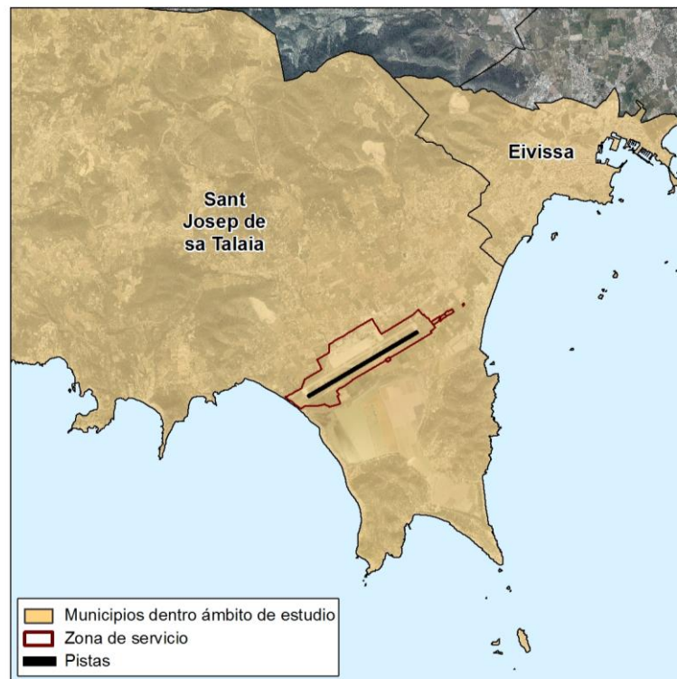
Ilustración 2. Municipios incluidos en el ámbito de estudio.

De acuerdo a la delimitación realizada, la zona de estudio se extiende parcialmente sobre los siguientes términos municipales: Eivissa y Sant Josep de sa Talaia. Su localización en relación con el aeropuerto de Ibiza puede apreciarse en la siguiente ilustración.