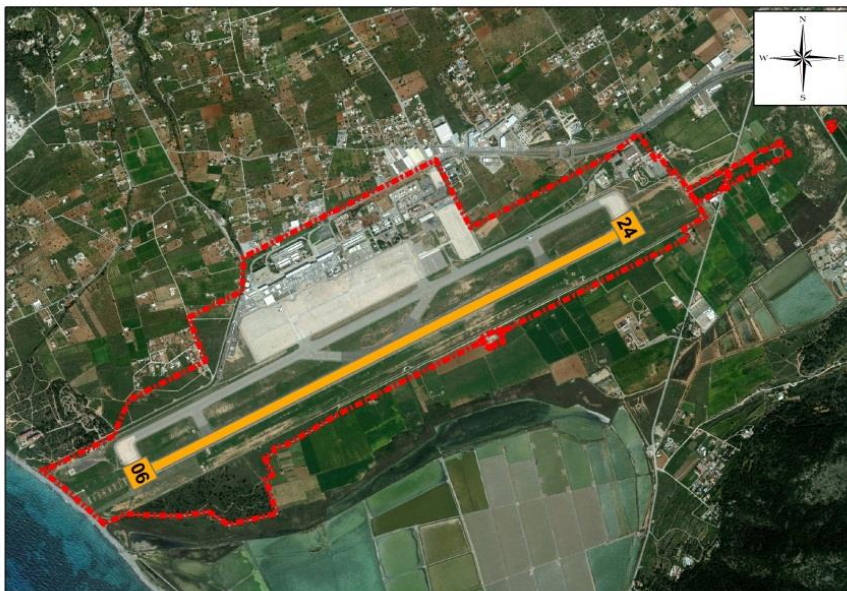
Ilustración 1. Localización de pista y umbrales en el aeropuerto de Ibiza

La figura siguiente representa la disposición de la pista y de cada uno de los umbrales en el aeropuerto.