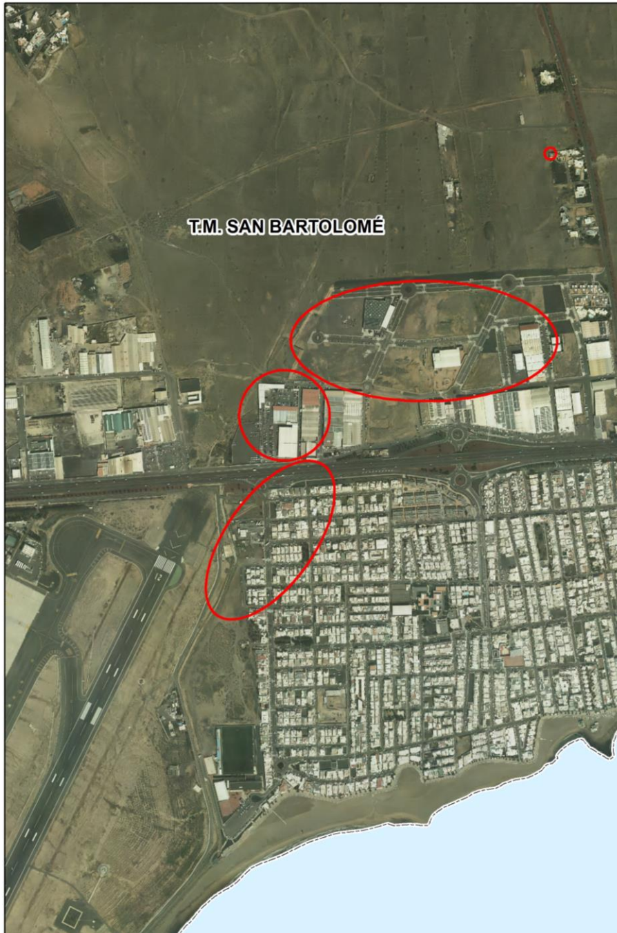
Ilustración 3. Localización de las zonas de superación