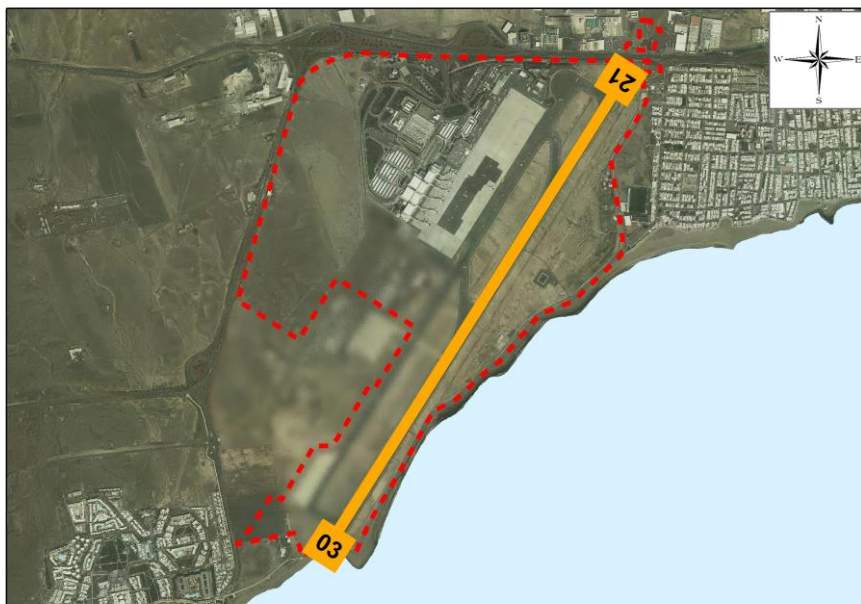
Ilustración 1. Localización de pista y umbrales en el aeropuerto de Lanzarote

La figura siguiente representa la disposición de la pista y de cada uno de los umbrales en el aeropuerto.