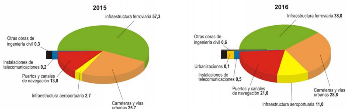
Gráfico2. Evolución de las adjudicaciones de obra de ingeniería civil del Grupo Fomento (distribución porcentual)