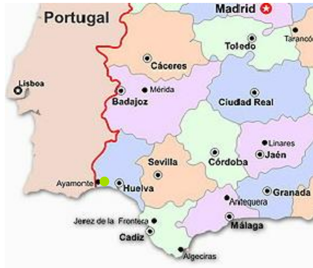
SITUACIÓN Sin Escala