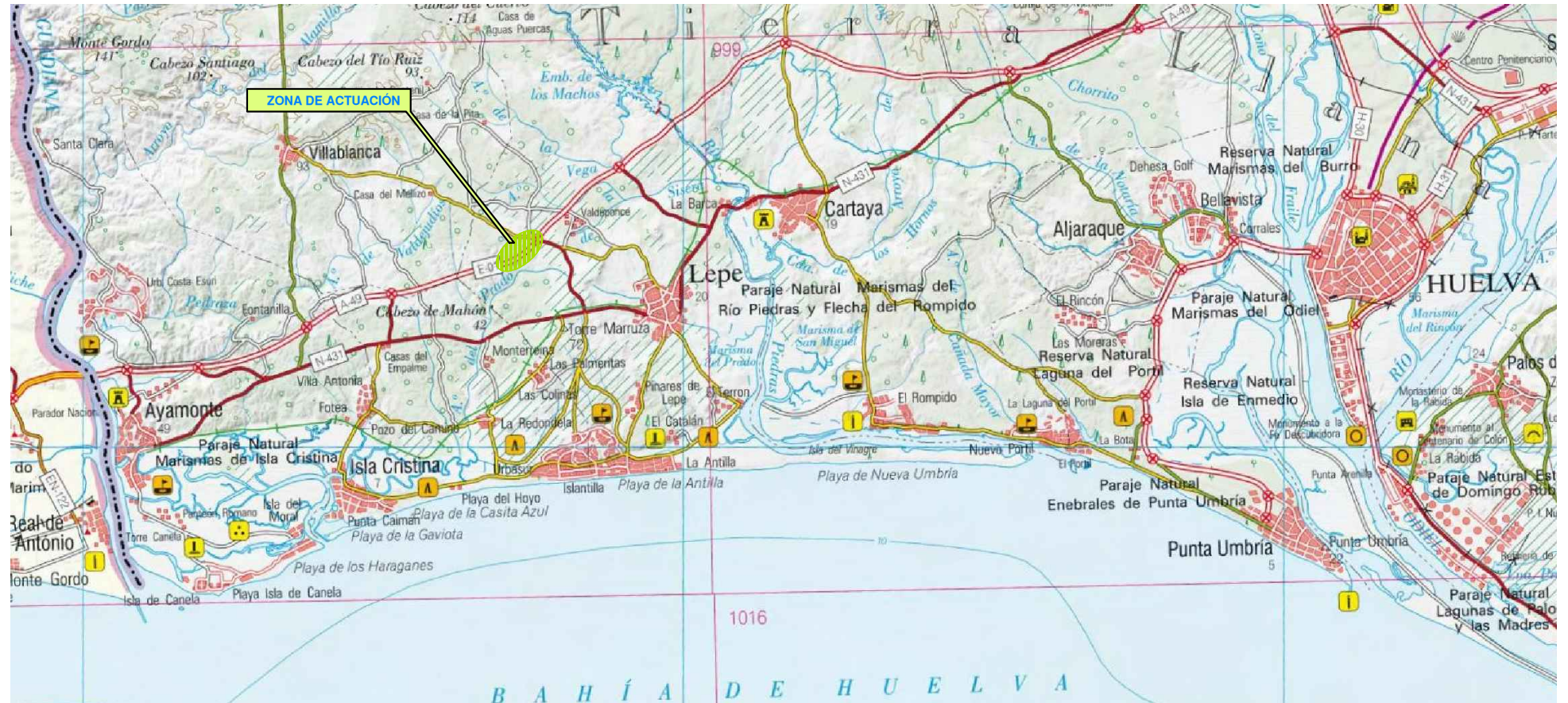
LOCALIZACIÓN GEOGRÁFICA 1:100.000