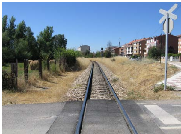
Lado León vista general desde el propio P.N.