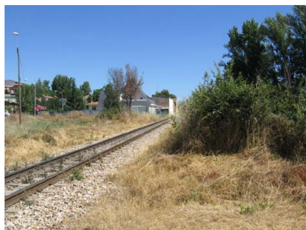
Lado Bilbao, desde el camino al otro lado del P.N.