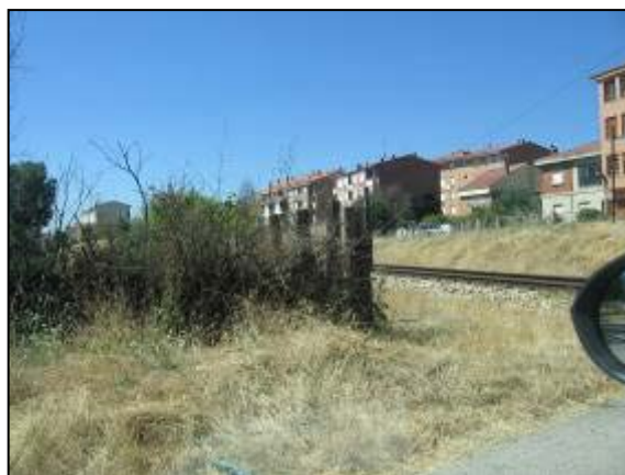
Visión desde el coche mirando hacia el lado León, desde el camino que da acceso al P.N. El morro del coche está a 3,5 m de la cara exterior del carril.

No obstante, en el cuadrante por donde llega el tren, la visibilidad existente hacia la vía desde donde se encontraba posicionado el vehículo siniestrado es de 152 m., distancia que puede en principio considerarse suficiente para que el vehículo arrollado se hubiera detenido y posicionado adecuadamente, de haberse percatado la conductora de la presencia del tren en el momento en que éste se hace visible para ella.