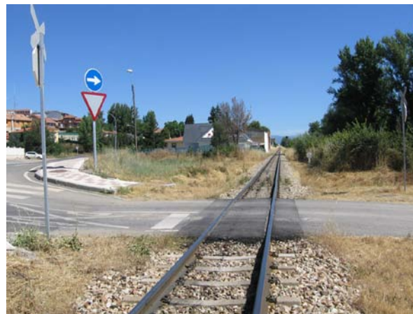
Lado Bilbao vista general desde el propio P.N.