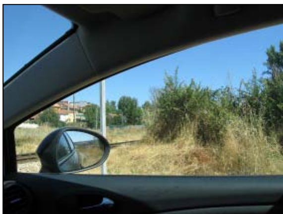
Visión desde el coche mirando hacia el lado Bilbao, desde el camino que da acceso al P.N. El morro del coche está a 3,5 m de la cara exterior del carril.

La distancia de visibilidad de los 4 cuadrantes es inferior a la distancia técnica (237 m) correspondiente a la velocidad de 80 Km. /h del tramo, especialmente desde el lado del camino, no adaptándose a la Orden Ministerial de 2 de agosto de 2001.