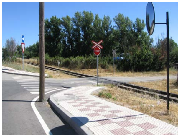
Lado Bilbao, vista general desde la carretera LE - 311