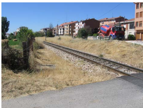
Lado León, desde el camino al otro lado del P.N.