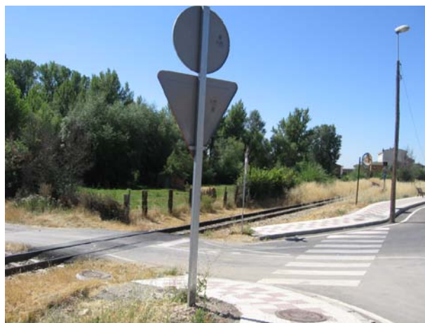
Lado León, vista general desde la carretera LE - 311