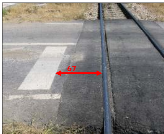
Línea de detención (lado carretera LE - 311)