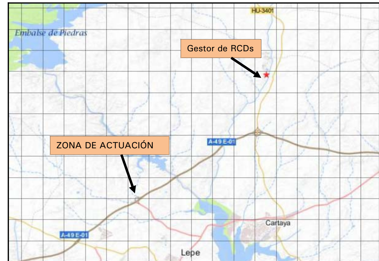
Situación Gestor de RCDs

El gestor autorizado de RCDs identificado durante la redacción del proyecto queda localizado en la cantera Gaspar Pereles, carretera HU-3401, km 4, Tariquejo, a 15 km de la obra.