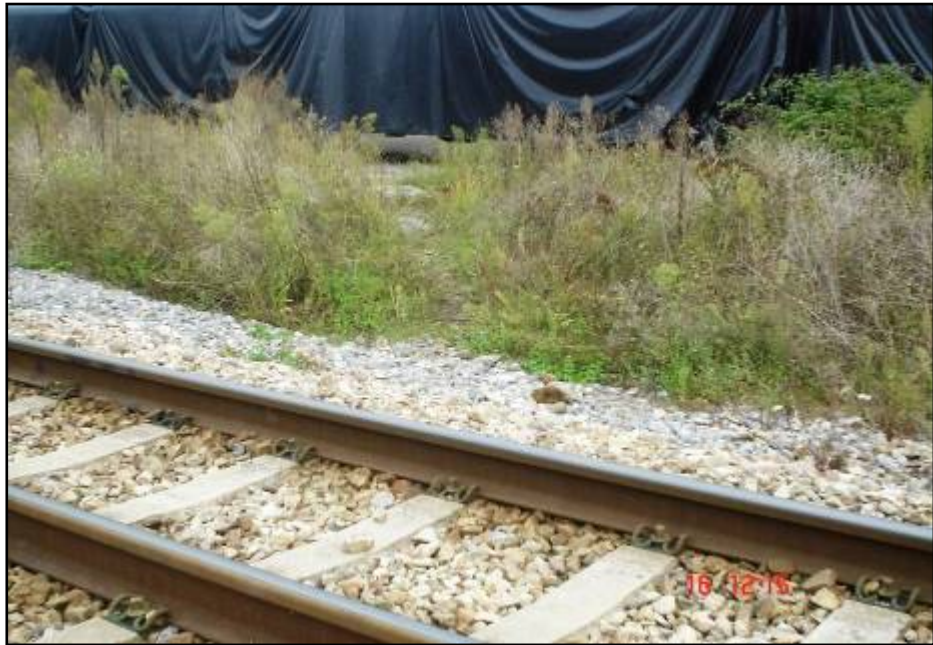
Paso vicioso por donde la gente cruza las vías