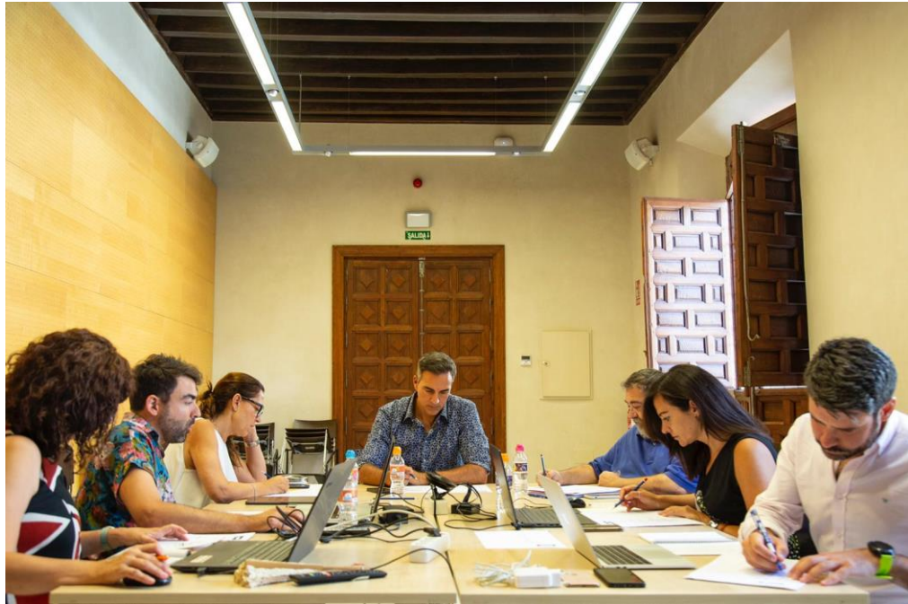
Imágenes de la reunión del jurado del festival