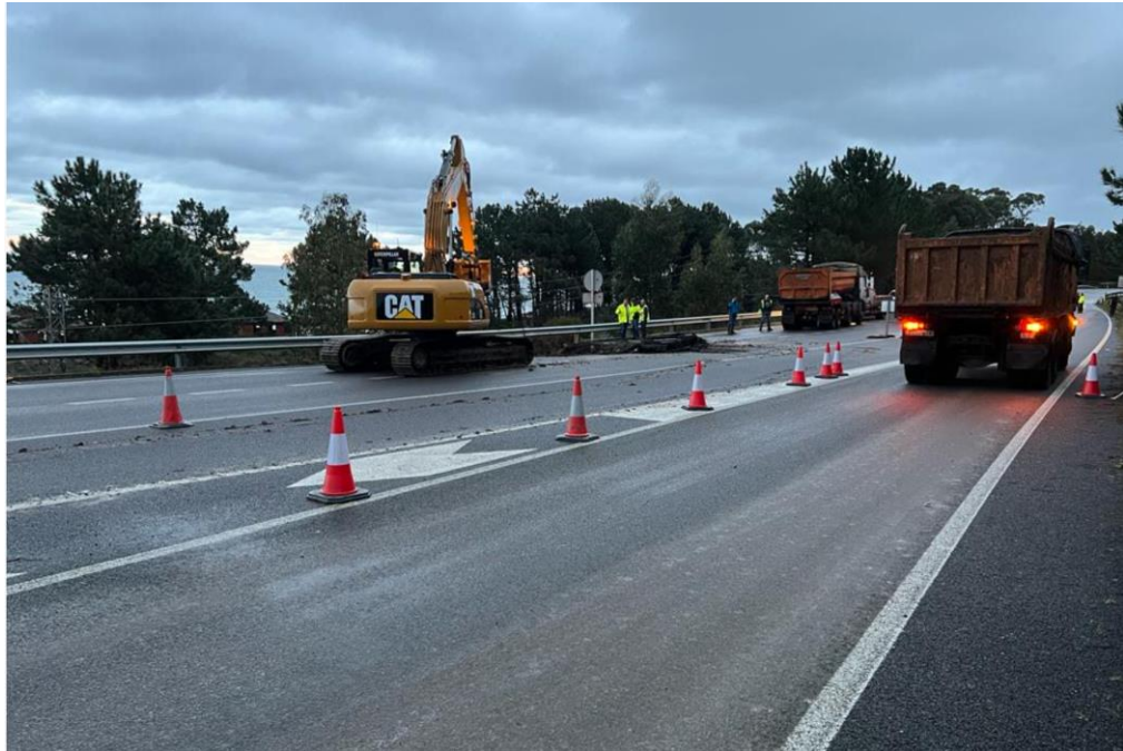
Máquinas y camiones trabajando en la zona