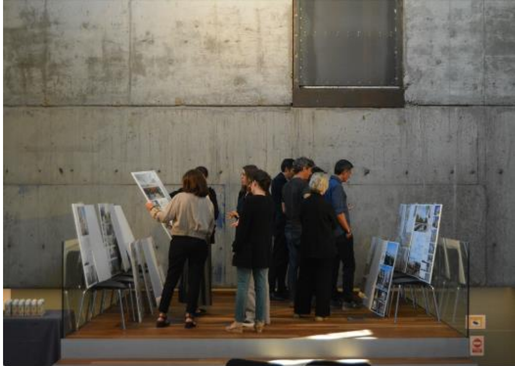
Imagen 1_Deliberación del jurado en la categoría 'Obras' XVI BEAU