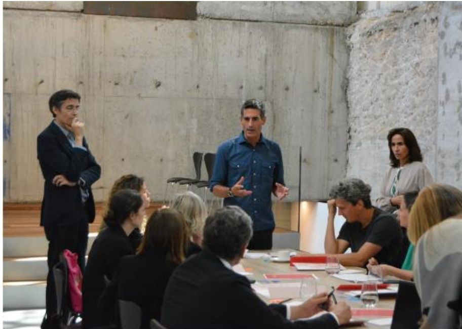
Imagen 3_Jornadas de deliberación del jurado XVI BEAU en la Sala La Arquería del MITMA